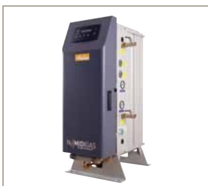
Generadores de gas nitrógeno de PSA MIDIGAS

La gama de generadores Parker incluye los siguientes modelos: