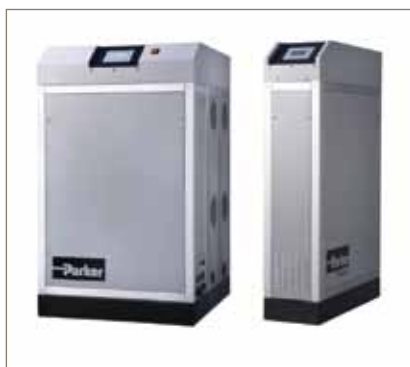
Generadores de gas nitrógeno de membrana NitroFlow