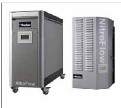
Generadores de gas nitrógeno de membrana NitroFlow basic

Consulte con su representante local de Parker para asegurar la selección de la solución correcta adaptada exactamente a sus necesidades.