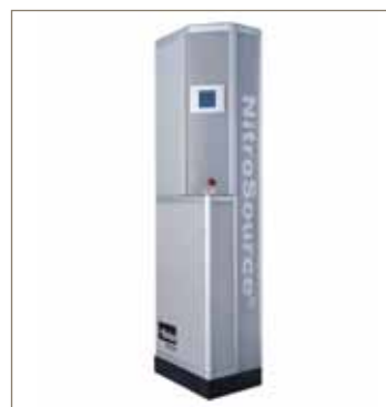
Generadores de gas nitrógeno de membrana NitroSource HiFluxx