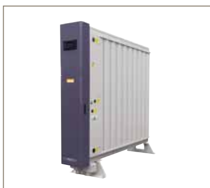
Generadores de gas nitrógeno de PSA MAXIGAS

Consulte con su representante local de Parker para asegurar la selección de la solución correcta adaptada exactamente a sus necesidades.